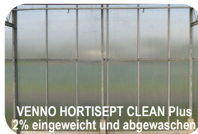
VENNO HORTISEPT CLEAN Plus 2% eingeweicht und abgewaschen