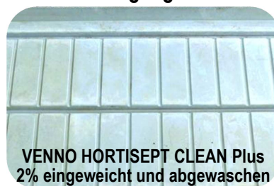
VENNO HORTISEPT CLEAN Plus 2% eingeweicht und abgewaschen