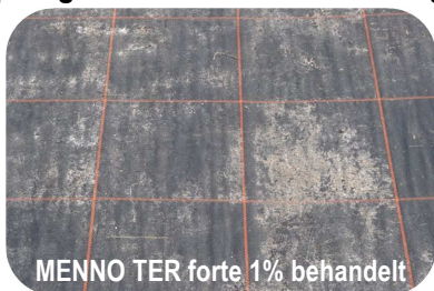
MENNO TER forte 1% behandelt