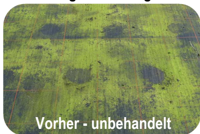
Vorher - unbehandelt