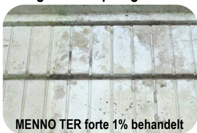
MENNO TER forte 1% behandelt