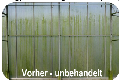
Vorher - unbehandelt