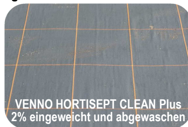
VENNO HORTISEPT CLEAN Plus 2% eingeweicht und abgewaschen